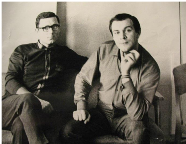
Фото 4 з Муслімом Магомаєвим

У тому ж неопублікованому інтерв'ю Валерій Курбанов зазначає: «...мої діди вибороли для мене право, народившись у Читі – називатися українцем та черкесом, а доля розпорядилася таким чином, що своє життя та творчий шлях я єдиний з усіх онуків порівну розділив між Баку та Києвом» 1 .