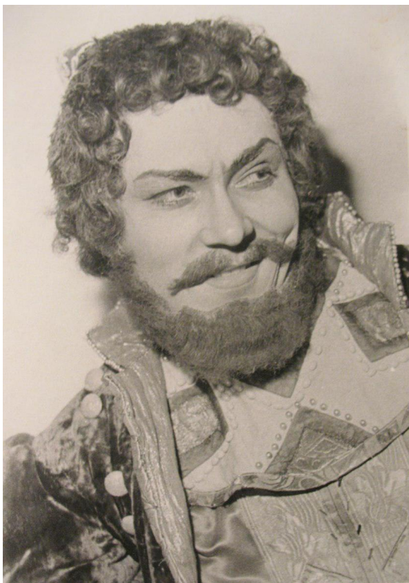
Фото 5 на сцені

Все це – безцінний театральний досвід, що став надзвичайною платформою для формування режисерської особистості, подальших методичних розробок кафедри оперної підготовки та музичної режисури у Києві.